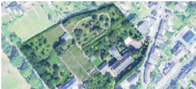
Zentrale Lage in Kommern

Mitten im Städtchen liegt die Wohnanlage in einem Park. Hervorgegangen aus dem ehemaligen Marillac-Haus, wurde sie für das Service-Wohnen im Alter vollständig umgebaut. Es entstanden modern geschnittene, helle Wohnungen in verschiedenen Größen für Senioren – Alleinstehende und Paare.