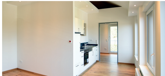
Viel Raum für eigene Ideen ...